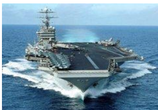
原子力空母ジョージワシントン 別紙のとおり危険なもの